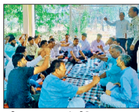
इंद्री। पावर हाउस में मीटिंग कर नारेबाजी करते कर्मचारी।