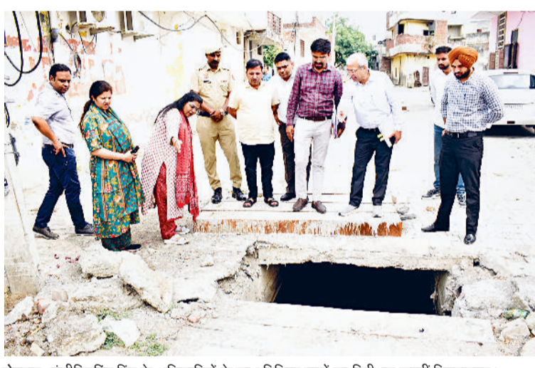
रोहताक। इंजीनियरिंग विंग के अधिकारियों के साथ विभिन्न नालों का निरीक्षण करती निगमायुक्त।

निगमायुक्त से सबसे पहले राम नगर क्षेत्र का दौरा कर मीरा घाटी डिस्पोजल तक जाने वाले नाले का निरीक्षण किया। बता दें कि इस