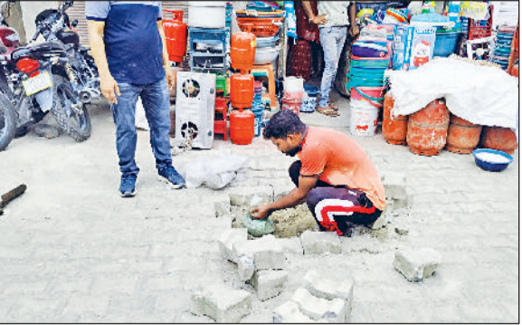
धरोड़ा। रेलवे रोड पर सैंपल लेती टीम।

शहर का सबसे व्यस्त रेलवे रोड माना जाता है, रेलवे रोड के निर्माण कार्य में कहीं न कहीं कथित लापरवाही बरती जाने को लेकर वार्ड के पार्श्वों ने इसकी शिकायत लगभग एक विभागीय अधिकारियों को कर दी थी जिसकी शिकायत के बाद मंगलवार को अबाला से क्वालिटी कंट्रोल की टीम रेलवे रोड पर पहुंची और टाइलों के सैंपल लिए। तीन सैंपल को तौर से कुछ टाइल व सामग्री साथ लेकर गई है। जिसको लेकर शहर के लोगों एकत्रित हो गए और उन्होंने भी निर्माण कार्य पर संदेह बताया है।