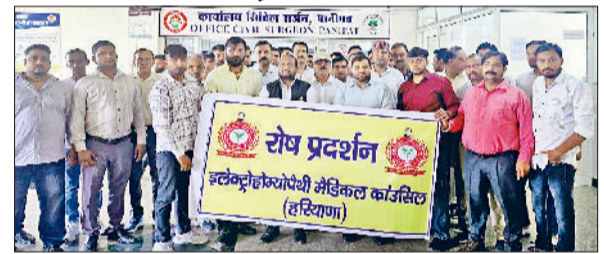
पानीपत। इलेक्ट्रो होम्योपैथी मेडिकल काउंसिल के सदस्य अपनी मांगों के समर्थन में प्रदर्शन करते हुए।