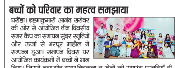
धरोड़ा। बहमाकुमारी आनंद सरोवर की ओर से आयोजित तीन दिवसीय समर कैम्प का समापन सुंदर स्मृतियों और उर्जा से भरपूर माहौल में सम्पन्न हुआ।