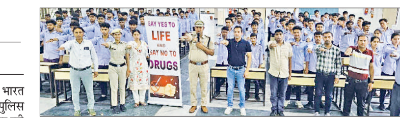
पानीपत। आईटीआई बापौली में नशे के विरुद्ध शपथ लेते हुए विद्यार्थी व टीचर्स।

हरियाणा पुलिस के नशा मुक्त भारत पखवाड़ा अभियान के तहत पानीपत पुलिस हर वर्ग का नशे के विरुद्ध जागरूक कर रही है। वहीं, अभियान के तहत पुलिस टीम ने मंगलवार को राजकीय औद्योगिक प्रशिक्षण संस्थान (आईटीआई) गांव बापौली में विद्यार्थियों को नशे के दुष्परिणामों की जानकारी देकर जागरूक किया और जीवन में