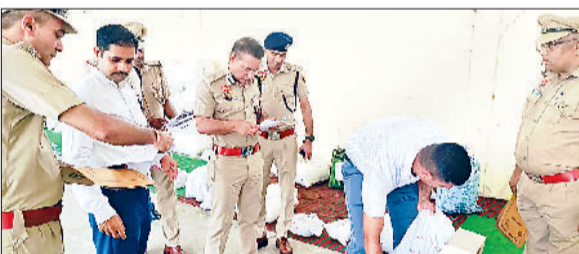
अंबाला। नशीले पदार्थों की जांच करते आईजी व अन्य पुलिस अधिकारी।