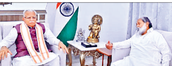
अंबाला। मनोहर लाल से मुलाकात करते मंत्री अनिल विज। फाइल फोटो

अंबाला-चंडीगढ़ के मध्य मेट्रो ट्रेन चलाने को लेकर ऊर्जा व परिवहन मंत्री अनिल विज ने केंद्रीय मंत्री मनोहर लाल से पिछले दिनों मुलाकात की थी। इसी मामले को लेकर पत्रकारों से बातचीत करते हुए ऊर्जा मंत्री अनिल विज ने बताया कि चंडीगढ़ केंद्र शासित है जोकि हरियाणा-पंजाब की राजधानी है। यहां कामकाज व व्यापार के लिए योजना हरियाणा-पंजाब आते-जाते हैं। मगर चंडीगढ़ जाने के लिए एकमात्र सड़क पर भारी यातायात रहती है। कई बार जाम की स्थिति बन जाती है। इसलिए हरियाणा, पंजाब व